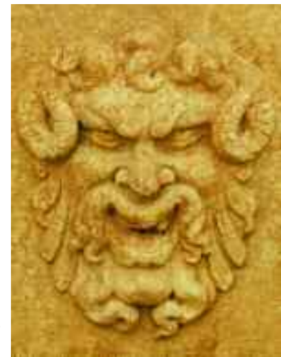
Avesa. Villa Scopoli, maschera sul portale di ingresso della peschiera.

Idealmente e geograficamente legato ad Avesa è l'abitato di Quinzano, separato da quest'ultima dal monte Crocetta. Conosciuto fin dall'alto Medioevo grazie ad uno xenodochio