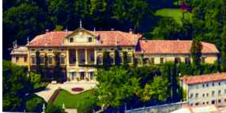
Valeggio sul Mincio. Villa Maffei-Sigurtà.

Villafranca, e più oltre fino alle pianure di Nogarole Rocca, per circa 17 Km. Dalla sommità della collina, il Castello Scaligero sovrasta Valeggio e la valle del Mincio, ancor oggi riproponendoci l'imponenza delle fortificazioni medievali. Di probabile origine longobarda, anche se le attuali strutture non risalgono a prima del X sec., solo con gli Scaligeri, signori di Verona, la fortezza che domina il