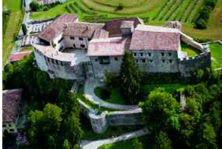
Stenico. Il Castello, veduta aerea.

e presente. Facciata dopo facciata, si inseguono scene da un matrimonio contadino, piccoli monelli intenti a rubare i dolci, le curve morbide e ammiccanti di una bella mora e i tratti spigolosi, dorati dal sole dei contadini intenti a mietere, l'arrotino sulla sua ingegnosa bicicletta, la lavandaia immortalata al lavoro sulla parete e quasi "immortale" quando si affaccia davvero alla finestra per salutare chi si avventura lungo il vicolo... Poco più in là ecco l'altro capolavoro dell'altopiano, che appare quasi scolpito nella montagna: Rango . Entrato a gran merito nell'Associazione "I Borghi più Belli d'Italia" è un raro e pregevole concentrato di architettura rurale delle Giudicarie, ormai praticamente scomparsa altrove e comunque mai sopravvissuta in un intero borgo. Il paese, un tempo tappa di pastori, mandriani e viaggiatori solitari nel loro peregrinare, si presenta come un complicato, affascinante intrico di tetti. Un