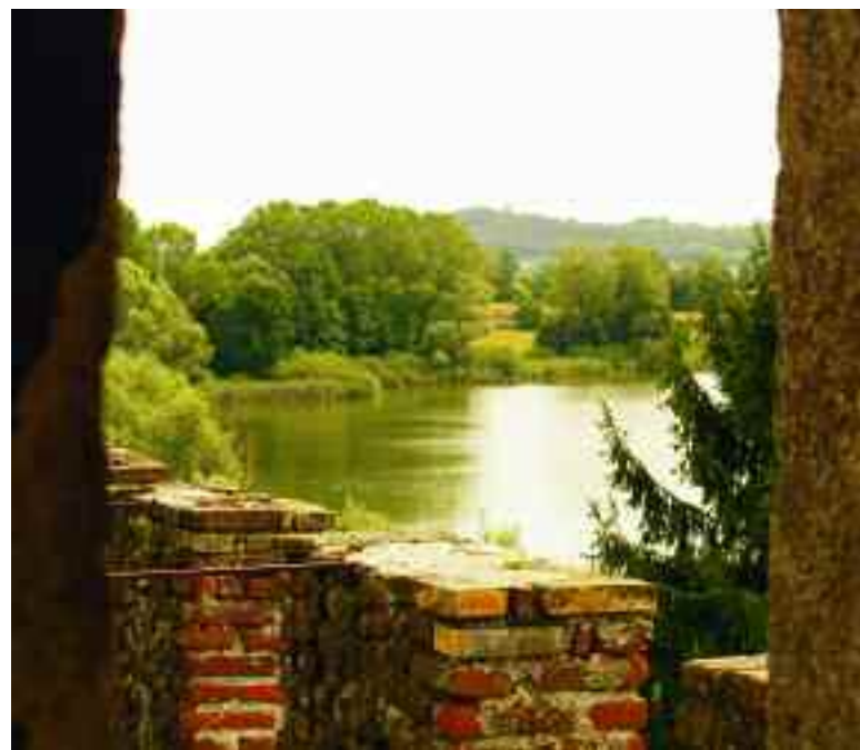
Castellaro Lagusello. Il lago visto dalle mura di cinta di Villa Arrighi-Tacoli.

torbose orlate di canne palustri e nel bosco, al riparo dal sole, si possono scorgere specie alpine che coesistono con quelle mediterranee. L'ambiente, situato