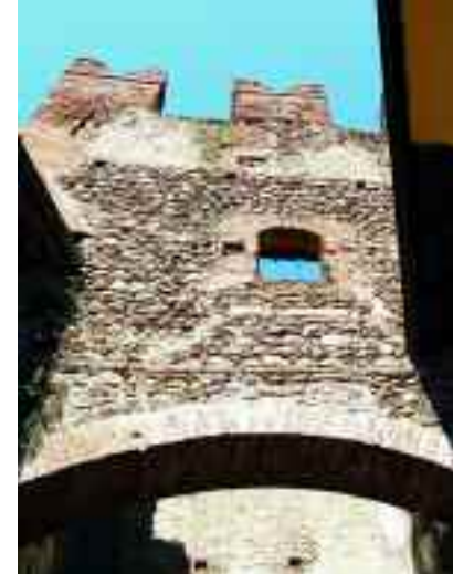
Borghetto. Torre medioevale.

Delle maggiori frazioni del comune, Borghetto è la più ricca di monumenti e di storia. La sua origine risale agli anni lontani della preistoria. Nel medioevo vi furono la corte regia, le proprietà dei Templari e i diritti dell'abbazia di San Zeno. Il centro più antico dell'abitato mantiene ancora oggi intatto il caratteristico aspetto del