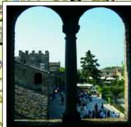
4. "Castellaro Lagusello, nobile borgo...", pag. 25