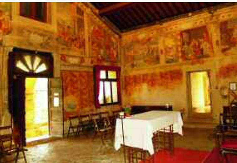
Quinzano, Verona. Chiesa di San Rocchetto, interno.

1596 notevoli modifiche vennero apportate al complesso, con la creazione di un avancorpo porticato e la realizzazione di un ciclo di affreschi sulla vita di San Rocco. Nel '700 infine venne modificata la copertura del campanile e creata la magnifica scalinata con esedra in tufo sul