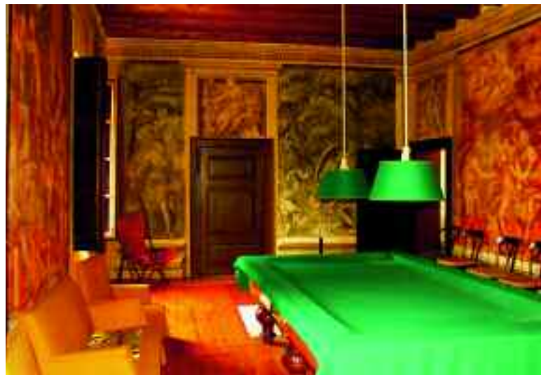
Mezzane di Sotto. Villa La Torre. Sala interna con affreschi del Farinati.

* Federico Dal Forno, Visione Storico Artistica della Valle di Mezzane , Ed. Fiorini