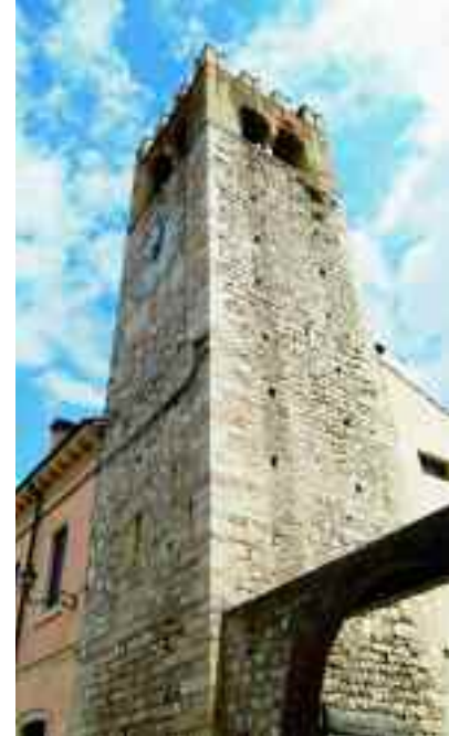
Mezzane di Sotto. Centro storico, la torre.

Proseguendo verso il centro del paese, dopo un breve percorso, sulla destra troviamo Piazza IV Novembre dove possiamo ammirare "(...) il bel campanile in tufo e vivo del secolo XI circa, con cella campanaria a bifore e a largo sviluppo; è stato trasformato in torre con la sostituzione dei merli nel 1891. Della stessa epoca