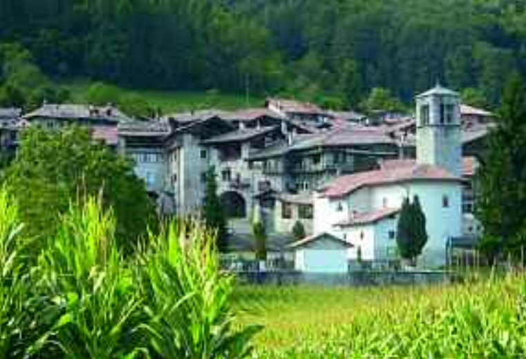
Il borgo di Rango.