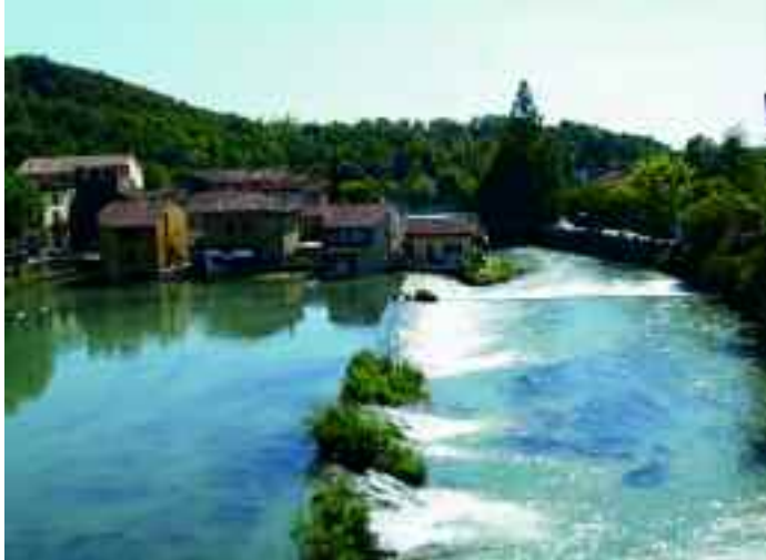
Borghetto, Valeggio sul Mincio, Verona.