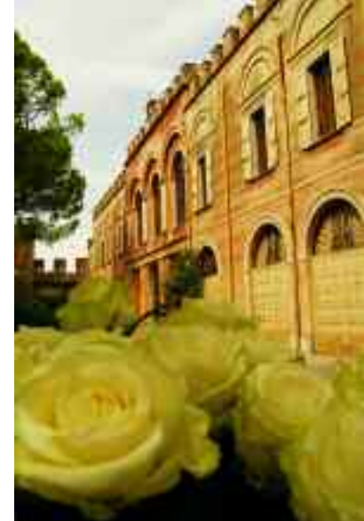
Castellaro Lagusello. Villa Arrighi-Tacoli, facciata interna.

L'intera area di Castellaro con il suo laghetto è sottoposta dalla Regione Lombardia, dal 1984, a un rigido vincolo di salvaguardia ambientale la cui gestione, è affidata al Parco Naturale del Mincio. Visitando l' Oasi Naturalistica , si potrà scorgere la vegetazione spontanea, le rive