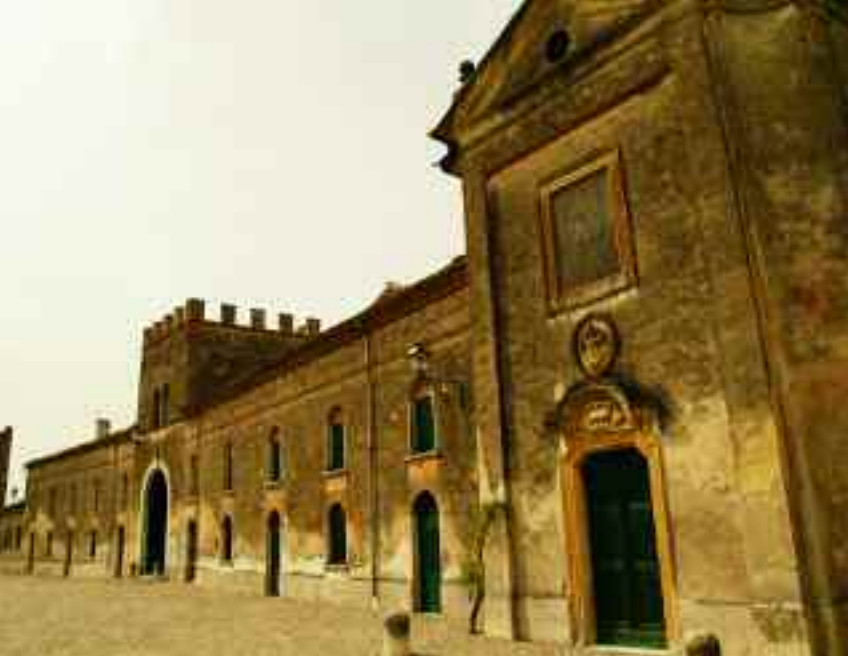
Castellaro Lagusello. Villa Arrighi-Tacoli, facciata esterna.

quella avvolta dai rampicanti, di fronte a Villa Arrighi-Tacoli, che non ci si stancherebbe mai di guardare perché rimasta intatta dal duecento.