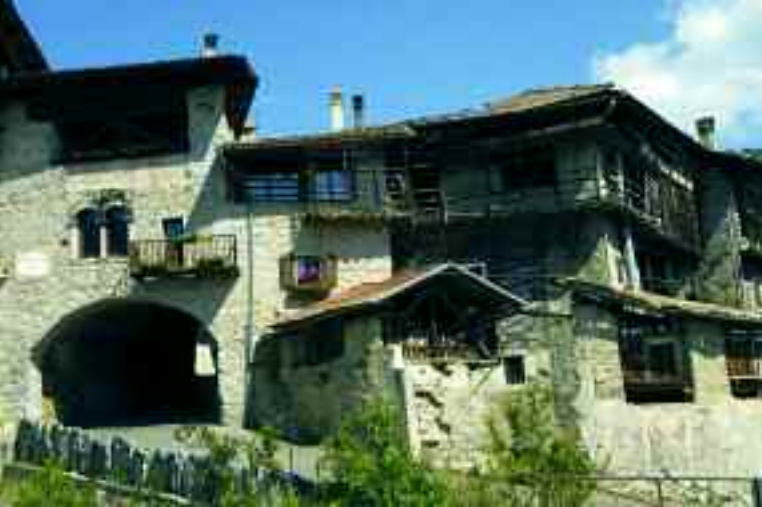
Rango, Bleggio Superiore, Trento. Ingresso del borgo.