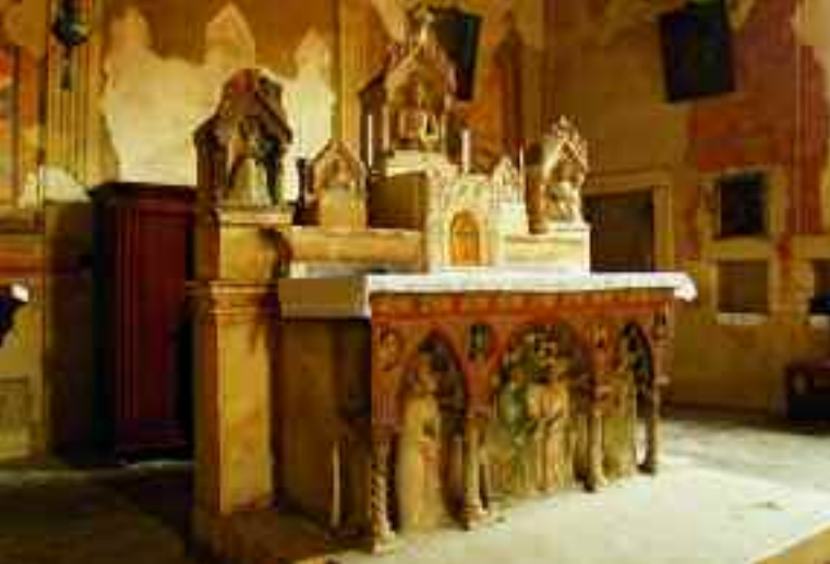
Avesa. Chiesa della Camaldola, l'altare con immagini in bassorilievo.

(ricovero per viandanti) voluto dal celebre Arcidiacono Pacifico, Quinzano rivestì un ruolo molto importante nella trasposizione cristiana che voleva Verona e i suoi colli come una sorta di "Jerusalem Minor". Il percorso sacro passava attraverso le chiese della S.S. Trinità di Monte Oliveto, del Sacro Sepolcro (ora Santa Toscana) e di Nazareth, presso Castel San Felice, terminando sul monte Cavro, sopra Quinzano.