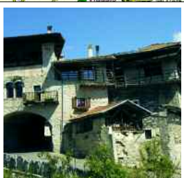
2. "L'architettura rustica del borgo di Rango", pag. 13