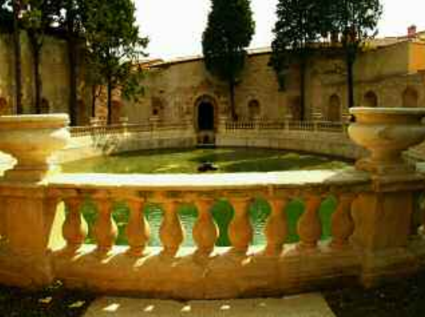
Avesa, Verona. Villa Scopoli, la peschiera.