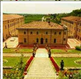
3. "Il borgo antico nella Val di Mezzane", pag. 19