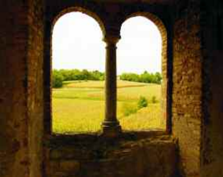
Castellaro Lagusello, Monzambano, Mantova. Bifora con veduta sui campi.