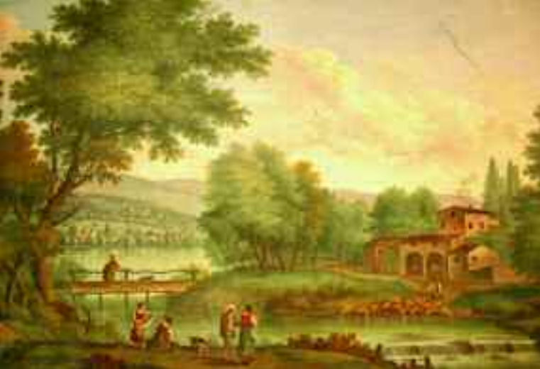
Mezzane di Sotto. Villa Maffei, affresco di Andrea Porta, 1786.

solo successivamente nel 1786 con una serie di affreschi di chiara influenza veneziana firmati da Andrea Porta, oggi è sede municipale. “La villa armonicamente è completata da un porticato ad archi con pilastri a bozze rustiche che si congiunge col primitivo edificio del sec. XVII con torretta piccionaia; antistante un vasto giardino con statue ed una secolare magnolia.” *