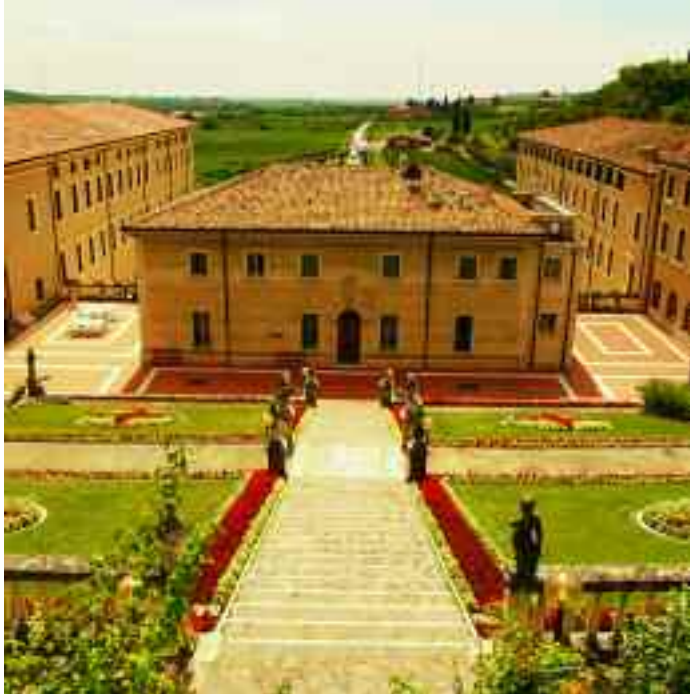
Mezzane di Sotto, Verona. Villa Roja-Schiavoni.