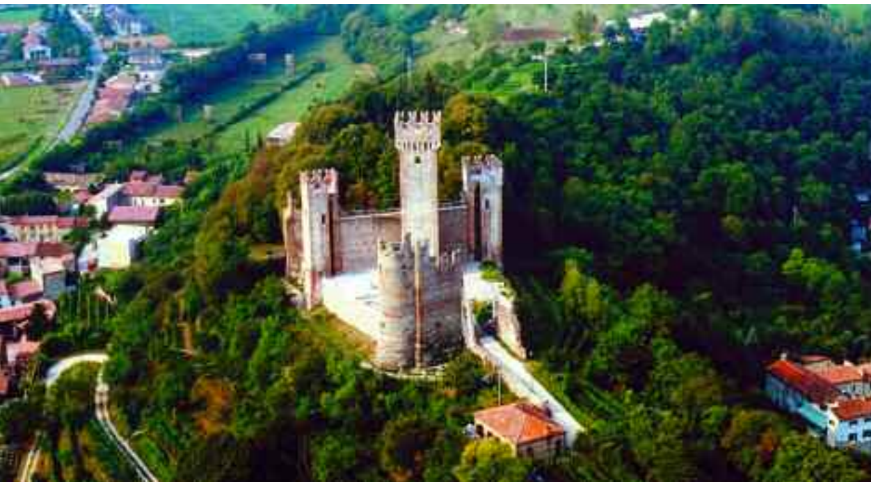
Valeggio sul Mincio. Il Castello Scaligero, veduta aerea.

ponte sul Mincio in legno e pietra detto di San Marco, le ruote dei vecchi molini, i resti della bastia scaligera e le vecchie case del borgo. A Borghetto domina la scena il Ponte Visconteo , straordinaria diga fortificata costruita nel 1393 per volere di Gian Galeazzo Visconti, Duca di Milano, allo scopo di garantire l'impenetrabilità dei confini orientali del ducato. Lungo 650 metri e largo circa 25, è comunemente chiamato "Ponte Lungo". Ultimato nel 1395, venne successivamente ricordato al sovrastante Castello Scaligero da due alte cortine merlate e integrato poi, per opera di Mastino II Della Scala, nel complesso fortificato del "Serraglio", che scendendo dal Castello, circondava il borgo di Valeggio e proseguiva lungo il fiume Tione fino al castello di