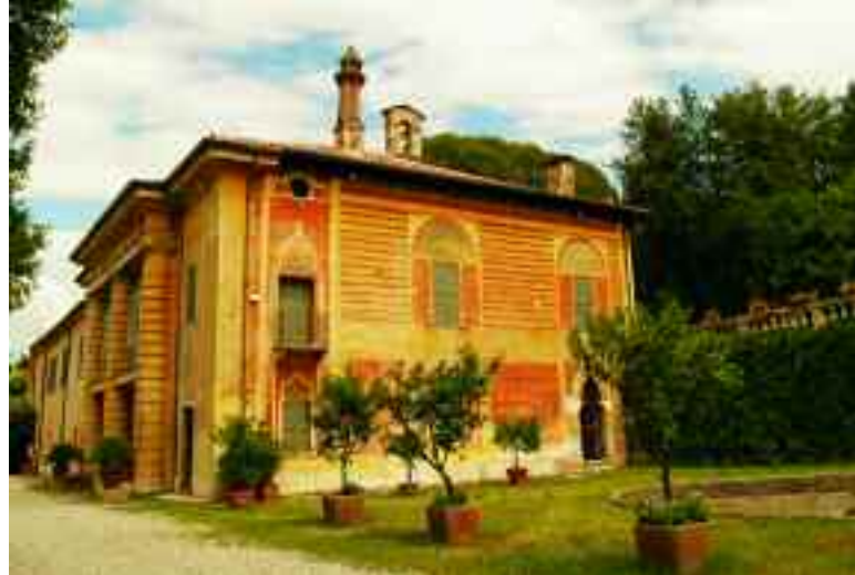
Mezzane di Sotto. Villa La Torre.

A est del paese Villa Della Torre , oggi proprietà Zavetti, “(...) fatta ammodernare dai nobili della Torre nei primi del 1500 su un edificio preesistente”. Di stile e fattezze palladiane, “verso la seconda metà del sec. XVI questo manufatto subì delle modifiche e in quell’epoca (1594) l’allora proprietario, conte Alvise, commise al pittore Paolo Farinati la decorazione. Il Farinati, in questa complessa opera, venne coadiuvato dai figli Orazio e Gianbattista. Di Paolo sono gli affreschi nella sala della conchiglia riproducenti l’allegoria del Trionfo della Fede sul Paganesimo , il Trionfo della Sapienza sull’Ignoranza mentre gli stucchi del soffitto, con stemmi araldici dei Della Torre e di famiglie imparentate per matrimoni, sono di Bartolomeo Ridolfi. Agli affreschi riproducenti i Quattro continenti allora conosciuti, Europa, Africa, America, Asia, va attribuito un pregio particolare per il gusto squisito con il quale sono stati