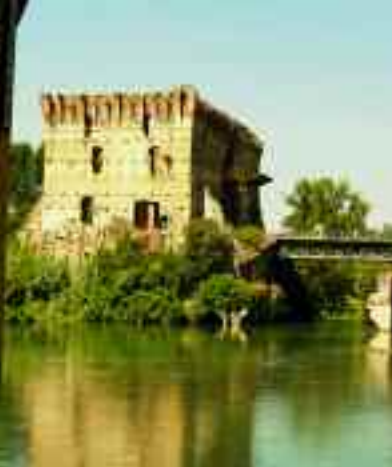
Borghetto. Il Ponte Visconteo.

viaggio nel tempo. La chiesa parrocchiale, una costruzione eseguita nel 1759 sul luogo di una più antica cappella di cui restano tracce, è un santuario dedicato alla Madonna del Borghetto (25 marzo). Altri importanti elementi monumentali presenti nel borgo storico sono la torre-campanile con l'antica campana scaligera, il