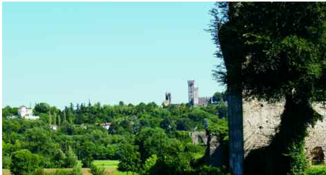
Borghetto. Il Castello Scaligero visto dal Ponte Visconteo.

borgo medioevale. La sua felice posizione lungo il Mincio, la valle, le colline e l'amenità del paesaggio, unite alla presenza del Castello Scaligero e del Ponte Visconteo, fanno di Borghetto una suggestiva meta per un