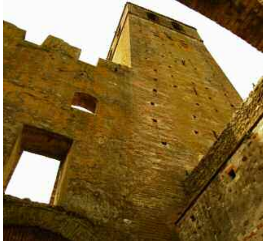
Castellaro Lagusello. La porta d'ingresso con torre.

Dal 2002 Castellaro Lagusello è entrato a far parte del Club dei Borghi più Belli d'Italia e tutt'ora ne mantiene il titolo.