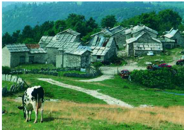
Roverè Veronese. Contrada Masenello

Si raggiunge la Conca dei Parpari (1390 m). Il nome, anticamente “Parparech”, sembra derivare da “Paar” (orso) e “Rech” (caprioli), indicando la presenza in passato di questi mammiferi. Si tratta di un ambiente caratterizzato dalla roccia del Biancone, ma con presenza anche di altre formazioni rocciose, come ad esempio il Rosso ammonitico. Si prosegue per Monticello di Roverè , e poi si passa per contrada Valle , un antico villaggio cimbro in pietra, provvisto anche di giassara. La caratteristica degli edifici della contrada è particolare, il tetto non è totalmente di lastame, ma misto e con una pendenza notevole, i lati e la canna fumaria sono in pietra, mentre il centro è in canna palustre. Ci si dirige dunque verso la Valle delle Sfini , che è nota per le particolari formazioni litologiche