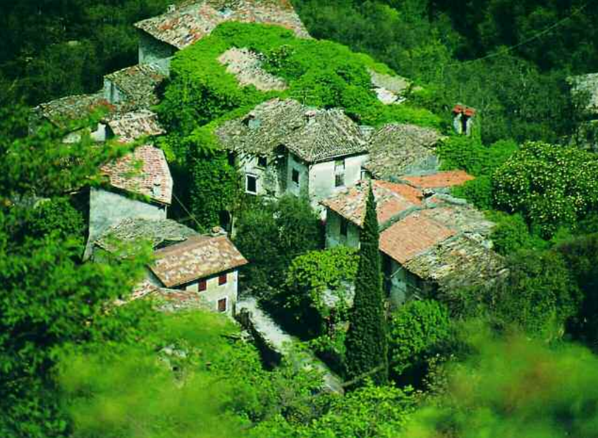
Brenzone. Uno scorcio di Campo