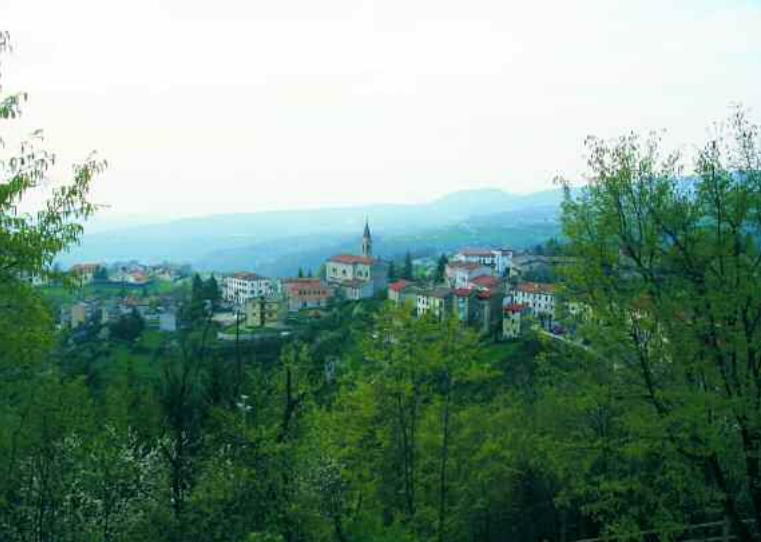
San Mauro di Saline. L'abitato