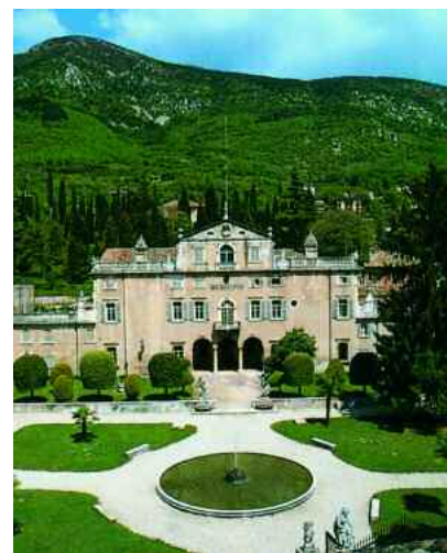
Caprino Veronese. Palazzo Carlotti

Seguendo una ripida mulattiera ci si inoltra nella Valbrutta , una zona vergine considerata una delle più antiche del Baldo, dal punto di vista boschivo. La foresta di Valbrutta è stata descritta anche da Giovanni Pona (1565-1630) che nel 1617 ne testimoniava la selvatichezza e naturalità perchè abitate da lupi e orsi. Si continua poi per la conca di Valfredda , i cui pascoli rinomati sono anch'essi stati citati dallo studioso.