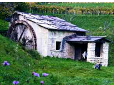
Negrar. Mulino a Contrada Noàl

legno ancora funzionanti. Risalendo si passa per il mulino di Capo e si prosegue per località Monspigolo , un'antica corte con colombara, una volta tutta recintata e chiusa da un portone. Durante una ripida salita, costeggeremo un ruscello e scorgeremo antichi ruderi di mulini.