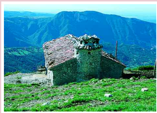
Caprino Veronese. Malga Colonè

Scendendo, si arriva poi alla contrada Faa ; quindi si costeggeranno meravigliosi prati di ciliegi fino a raggiungere Ca' del Gallo e subito dopo contrada Bottega , da cui si ritorna poi al piazzale della chiesa di Torbe.