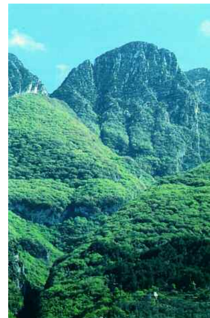
Il Monte Baldo visto dal Lago

Da qui si può anche ammirare l'abitato di Campo con l'imponente muraglione dell'antico castello ricoperto di edera e il piccolo campanile. Si sale lungo l'acciottolato e, oltrepassato un vòlto, si scorge poco più avanti la chiesetta di San Pietro in Vincoli , costruzione di epoca tardo romana, che all'interno presenta