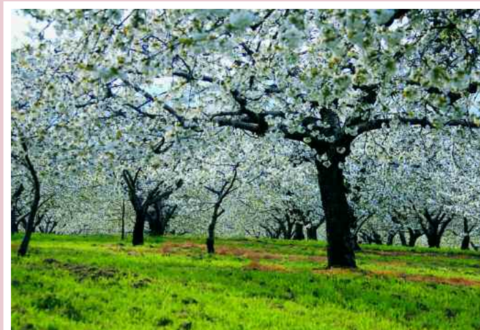
San Mauro di Saline. Ciliegi