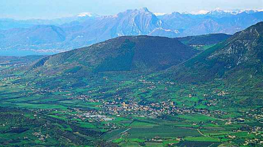
La vallata di Caprino Veronese vista da Monte Pastello