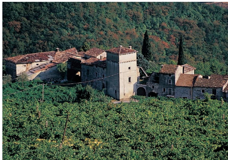
Negrar. Contrada Noàl

Domenica si parte dal piazzale della Chiesa parrocchiale di Torbe (450 m) con visita alla chiesetta romanica di San Pietro . Si scenderà dunque sulla destra fino alle contrade di Galdè e Noàl (348 m) dove è visibile un antico