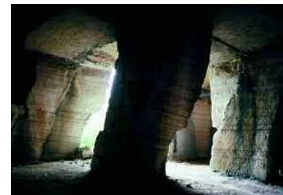
Negrar. Le cave di Prun

Passando vicino all'antica chiesetta di Santa Cristina , si arriva poi in località Faa , un borgo con tutte le case fatte in pietra. Proseguendo, si raggiungono le Cave di Prun , antichi scavi dai quali si estraeva la pietra della Lessinia che, fin dalla preistoria, l'uomo ha usato per le coperture delle capanne e le recinzioni dei villaggi. Dal 1200 circa venne avviata l'escavazione in galleria e per sostenere il tetto a volta venivano lasciate delle