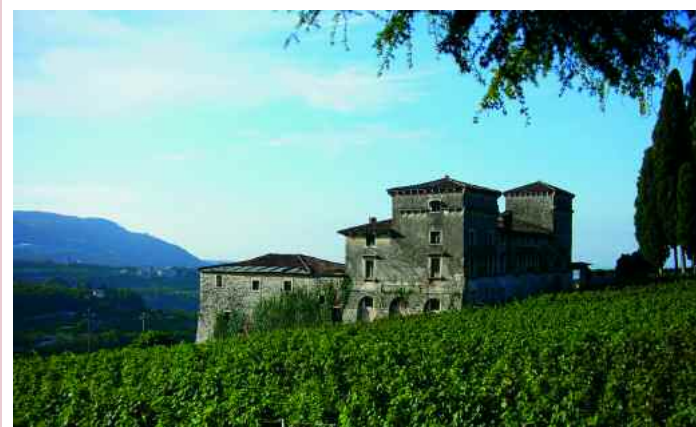
Negrar. Villa Salvaterra a Prun vista da Nord