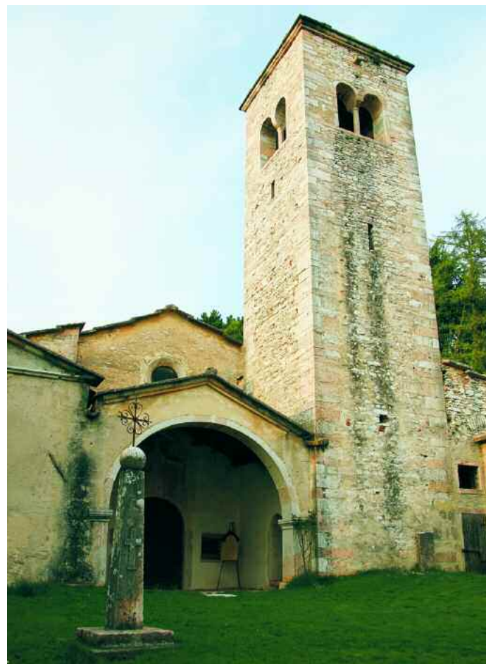
San Mauro di Saline. Chiesa di San Moro

nelle forme attuali, il luogo divenne meta di molti pellegrinaggi, provenienti per lo più dalle zone orientali della provincia di Verona e dal Vicentino. L'edificio, che in facciata ostenta un porticato ligneo, mostra arcate gotiche a sesto acuto e tre absidi: “si tratta - a dirla con Francesca D'Arcais - di una delle rare trasposizioni in una zona remota e lontana di forme d'architettura gotica che solo alla fine del Trecento, dunque, appare essere il linguaggio diffuso e comune anche dell'architettura del territorio”. La chiesa ospitava un tempo anche una serie di singolari ex-voto: statue in ferro che,