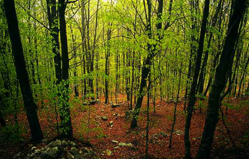
Roverè Veronese. Faggeta