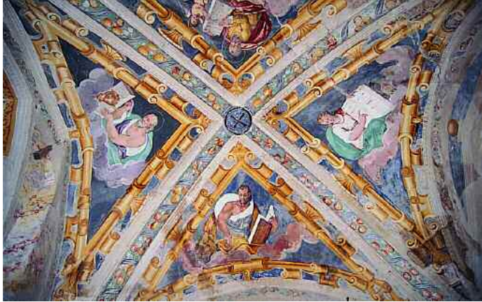
San Mauro di Saline. Affreschi all'interno della chiesa di San Moro

rinvenute alla fine del secolo scorso, restaurandosi il campanile, furono poi custodite dal Museo di Castelvecchio di Verona che, nel frattempo, le ha date in temporaneo deposito al Museo di Boscochiesanuova. L'uso di accompagnare le manifestazioni di culto al santo con l'offerta di statuette in ferro sarebbe posteriore al secolo XI, ed è testimoniato anche altrove, ad esempio, nella diocesi di Bressanone. La domenica, oltre all'itinerario sul Monte di San Moro, si farà un percorso tra le contrade a nord di San Mauro di Saline. Lasciando il paese, si attraversa un bel bosco di castagni e si raggiunge contrada