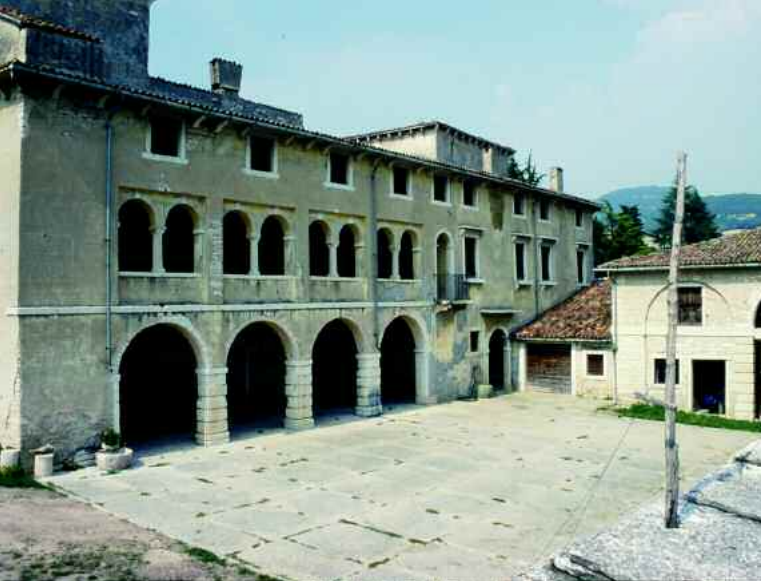
Negrar. Villa Salvaterra a Prun