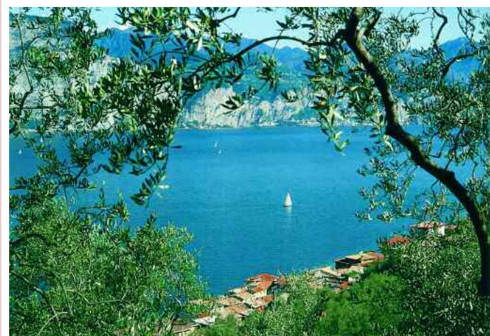
Brenzone. Veduta panoramica su Magugnano