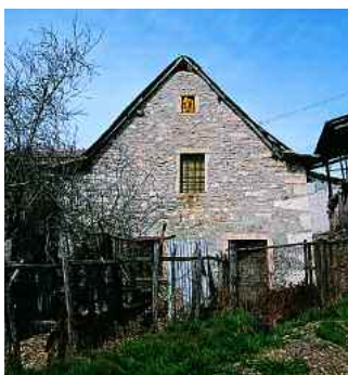
San Mauro di Saline. Teda a Spillichi

Sella (m 692). Questa prende il nome dalla sua particolare posizione, proprio su una sella che domina la vallata e da cui si può scorgere l'abitato di San Rocco di Piegara verso sud-ovest, il suggestivo Vajo della Gorla ad ovest, e la dirimpettaia contrada Campari, nel territorio di Roverè. Si prosegue poi verso la contrada di Spillichi (m 835). Questa si scandisce in un insediamento molto ampio e articolato. All'inizio si nota sulla sinistra l'antico "baito de la contrà" per la lavorazione del latte, oggi in disuso, sulla destra si apre una specie di piazzetta contornata da una schiera di abitazioni ed una di stalle-fienili; dietro uno di questi si trova un antico pozzo in pietra per la raccolta dell'acqua. Si giunge a Comerlati (m 807), grande e bella contrada abitata fino agli anni 30 da una quindicina di famiglie. Si presenta ricca di bei particolari da scoprire: dal baito alla porticina del pollaio, dal bel portale della casa padronale al tetto del fienile di fronte, che mostra ancora sotto la lamiera l'antica copertura in canna palustre. Scendendo poi, raggiungiamo San Mauro.