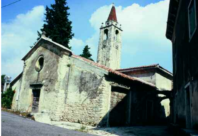
Negrar. Antica chiesa di San Pietro a Torbe