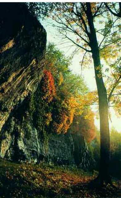
Brenzone. Rocce erose dal ghiacciaio a Tormentaje

Due intere giornate nel territorio del Comune di Brenzone che costituisce, con i suoi cinquanta kmq di superficie, uno dei Comuni più estesi della provincia veronese. Brenzone è una perla incastonata sulla sponda veronese del Garda. Situato al centro del lago è storicamente zona di transito per i commerci fra Pianura Padana e Alpi e quindi, anche linguisticamente, il comune è figlio di una triplice cultura: veronese, bresciana e trentina. Alle spalle di Castelletto, Magugnano, Porto ed Assenza, i centri più grandi che si specchiano sulla superficie del Garda, frazioni altrettanto affascinanti si inerpicano sulle colline, tra il verde di ulivi e castagni: sono Castello, Sommavilla, Pozzo, Borago, Boccino, Prada, Biaza, Fasor e, dulcis in fundo, Campo, borgo medievale oggi