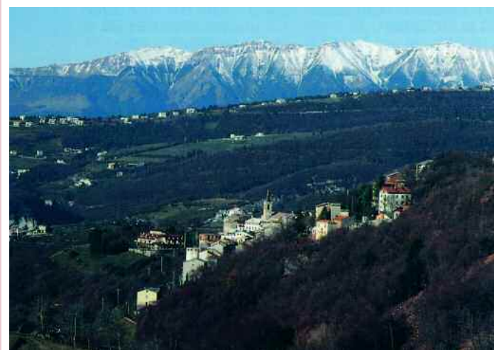
Roverè Veronese. Veduta panoramica

Sella (m 692). Questa prende il nome dalla sua particolare posizione, proprio su una sella che domina la vallata e da cui si può scorgere l'abitato di San Rocco di Piegara verso sud-ovest, il suggestivo Vajo della Gorla ad ovest, e la dirimpettaia contrada Campari, nel territorio di Roverè. Si prosegue poi verso la contrada di Spillichi (m 835). Questa si scandisce in un insediamento molto ampio e articolato. All'inizio si nota sulla sinistra l'antico "baito de la contrà" per la lavorazione del latte, oggi in disuso, sulla destra si apre una specie di piazzetta contornata da una schiera di abitazioni ed una di stalle-fienili; dietro uno di questi si trova un antico pozzo in pietra per la raccolta dell'acqua. Si giunge a Comerlati (m 807), grande e bella contrada abitata fino agli anni 30 da una quindicina di famiglie. Si presenta ricca di bei particolari da scoprire: dal baito alla porticina del pollaio, dal bel portale della casa padronale al tetto del fienile di fronte, che mostra ancora sotto la lamiera l'antica copertura in canna palustre. Scendendo poi, raggiungiamo San Mauro.