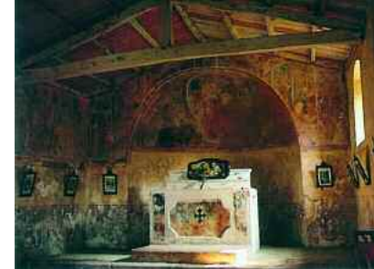
Campo. Chiesa di S. Pietro in Vincoli, interno

dell'Aiuto , di fronte a un muretto, si erge un capitello dedicato al Crocefisso.