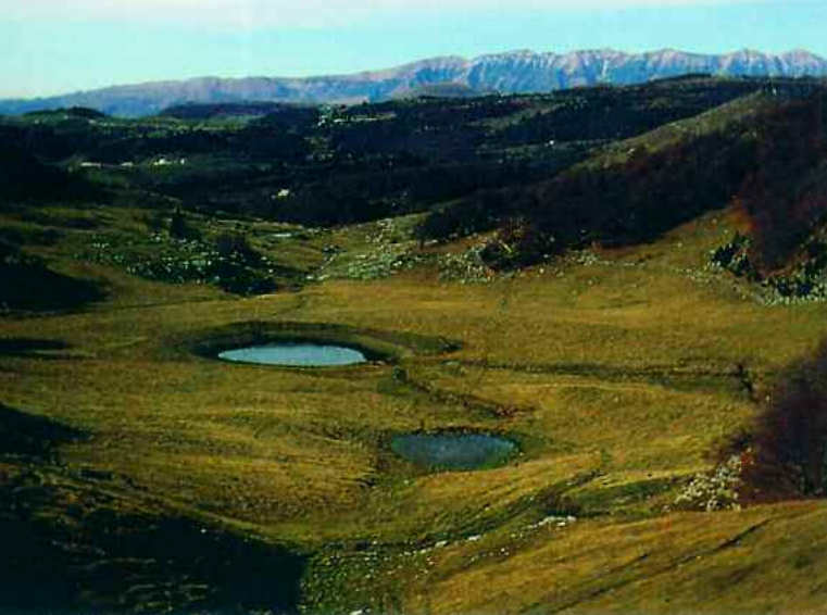
Roverè Veronese. La Conca dei Parpari

che caratterizzano l'area. Si tratta di una serie di monoliti formati grazie alla diversa erosione di due tipi di calcare che compongono queste strutture; la base, costituita da Calcarea Oolitica di colore bianco-giallastro, risulta più assottigliata