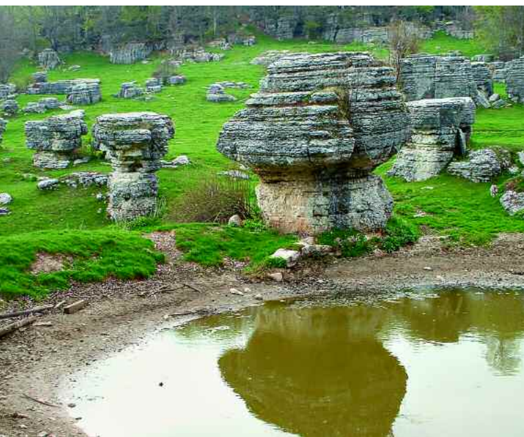
Roverè Veronese. La Valle delle Sfingi a Camposilvano.

rispetto la parte sommitale, composta invece da Rosso Ammonitico, in quanto più facilmente erodibile. Dopo una visita a questa affascinante valle, unica nel suo genere, si ritorna a San Francesco.