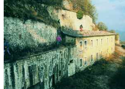
Caprino Veronese. Forte Cim Grande

Si raggiunge Ime (1132 m), oggi azienda agrituristica, che si presenta con un'ampia costruzione che fu nel XVIII sec. residenza dei Canossa ed in seguito è divenuta famosa per l'allevamento selezionato dei cavalli. Da questa bella conca la strada sale costeggiando sulla destra un bosco di betulle seguito da una valletta racchiusa da larici, e si dirige verso un secolare bosco di faggi. Percorrendo un sentiero si raggiunge Malga Ime (1175 m). Da qui, si sale attraverso un bosco di faggi e si giunge alla Fontana Valbrutta (1272 m), sistemata durante la prima Guerra Mondiale. Si risale poi verso Malga Colonè di Caprino (1372